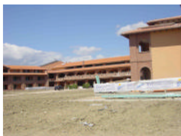
Vue d'hôtel encore en chantier ...